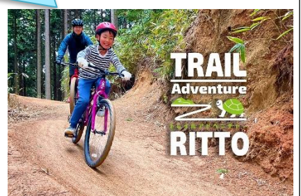
キャノピーコース

小学2年生までは大人の同伴が必要となります。 ※大人1名につき4名まで。ご利用条件をご確認ください。