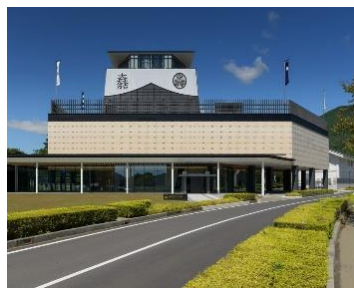
岐阜関ヶ原古戦場記念館