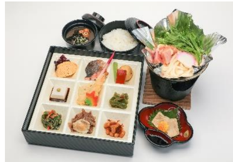
(写真は、イメージです。)