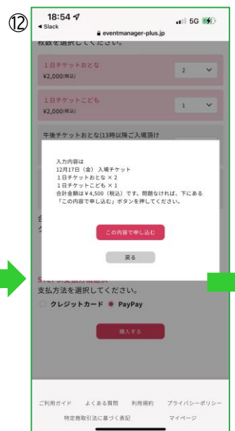
【チケット選択ページ】 最後に購入内容を確認して 「この内容で申し込む」をタップ