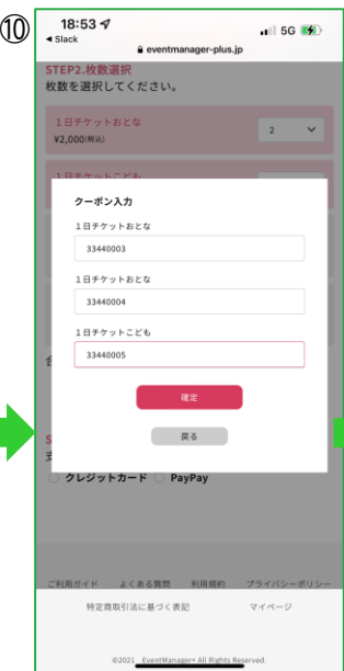
【チケット選択ページ】 購入予定の全チケット券種(枚数)が 表示されます クーポンコードを使用する各チケットに コードを入力して「確定」をタップ ※クーポンコードを使用しない チケットには何も入力しないでください