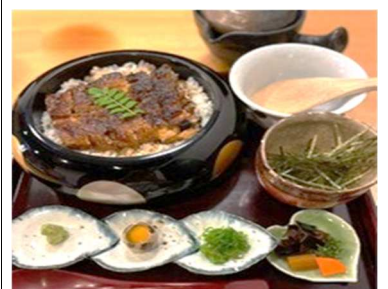
1/22「うなぎのひつまむし」