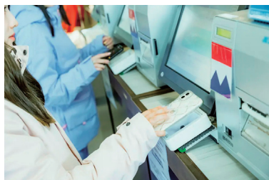
各スキー場に設置してある 無人発券機にQRコードをかざし、 リフトチケットを受け取りましょう。