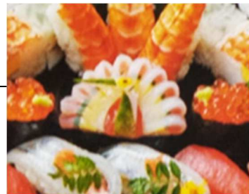
写真の中央が細工すし(クジャク)