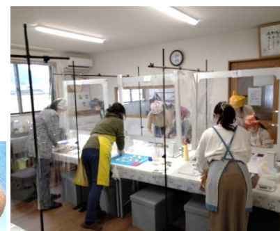
(写真はすべてイメージです)