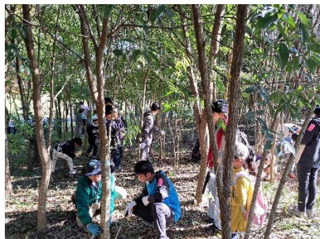
間伐・枝打ちの様子