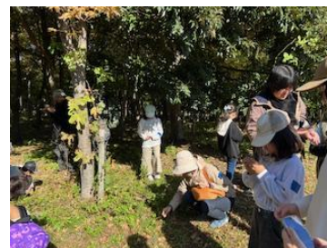
自然観察・散策の様子